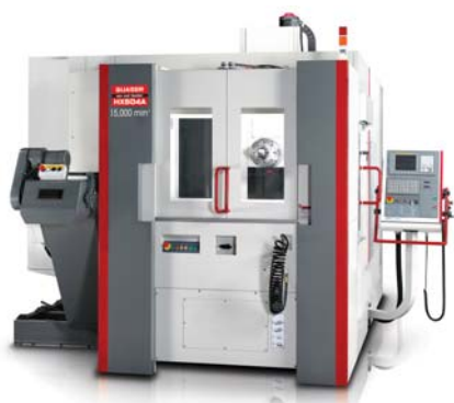
Dvojpaletové horizontálne centrum